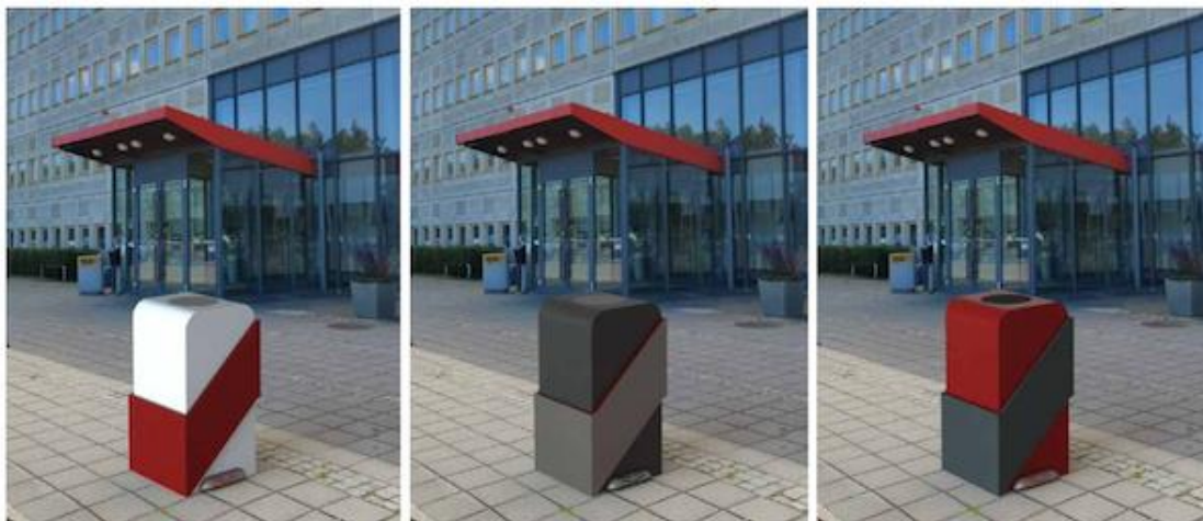
Toyota Material Handling - soptunna

Konceptuppdragen fick vi i år från Brigo i Mölndal och från Toyota Material Handling, Mjölby.