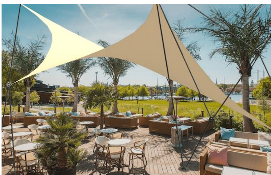
Brigo Mölndal – solskydd/avdelare

Konsumentprodukten skulle i år bli en papperskorg som utgick från ett ark av polypropen i formatet 70 x 100 cm. Tanken var att den skulle kunna transporteras som ett platt paket, kan vikas ihop till en form, utan hjälp av lim, nitar eller annat material. Vår leverantör var Inplastor i Motala, som generöst bidrog med material och tillverkning. I samband med tillverkningen fick eleverna besöka Inplastor.