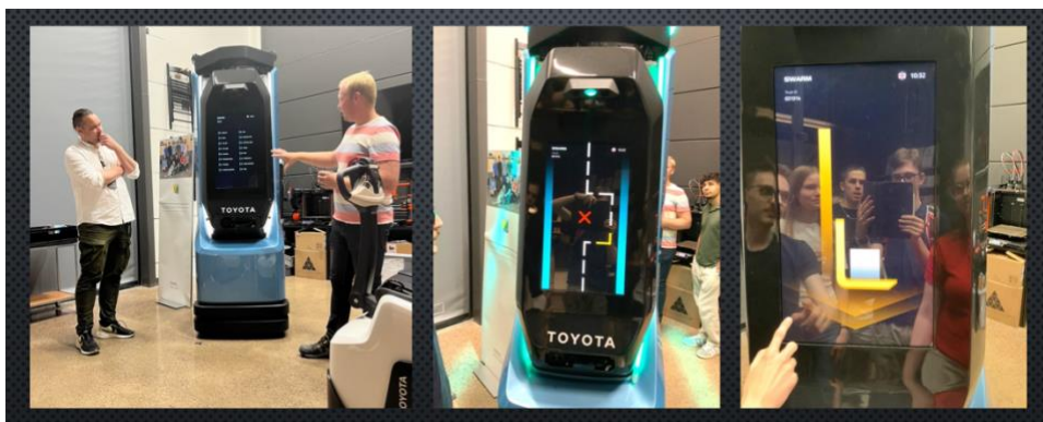
Toyota Material Handling – gränssnitt på skärm för robottrucken SWARM