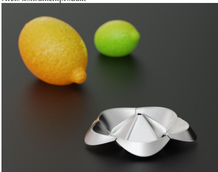
Citruspressen "Lotuspress" för Stilfold